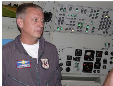
Einweisung in den Simulator