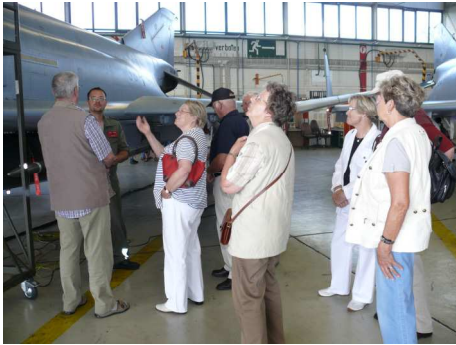
in der Inst Halle