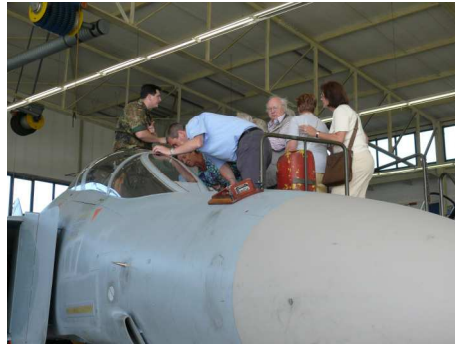
der Blick in das Cockpit